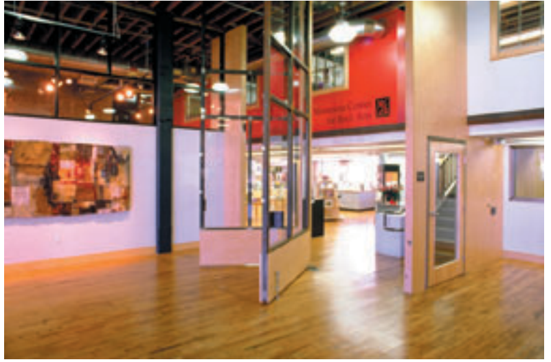
Asma kat, Minnesota Kitap Sanatları Merkezi.