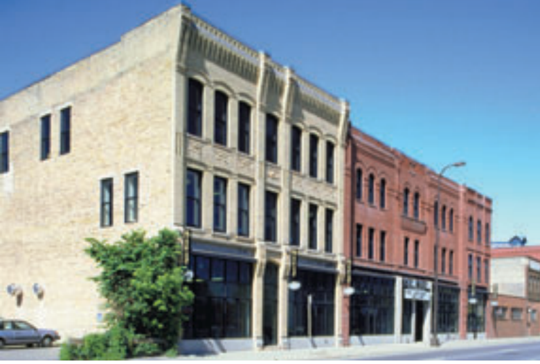
Yapının yenilenmiş dış cephesi.