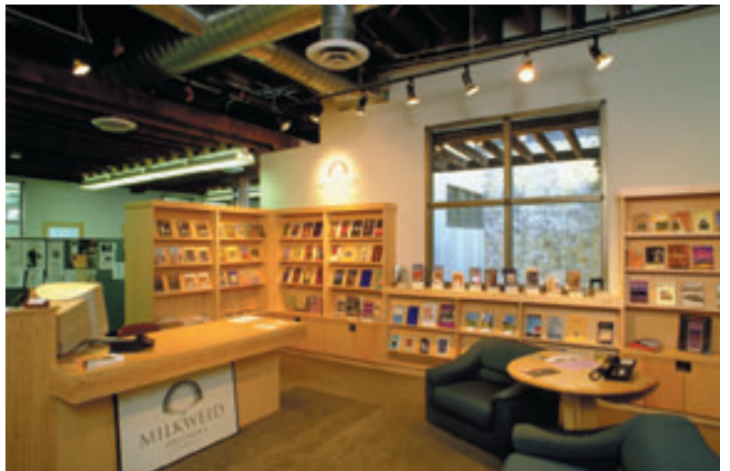
3. kat, Milkweed Yayınevi.