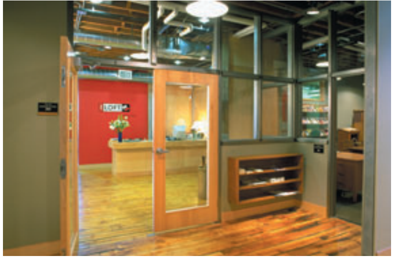
2. katta "The Loft" Literatür Merkezi.

Üstte binanın merdivenler... Bir kitap sanatçısıyla birlikte tasarlanmış merdivenin korkuluklarının her biri, ayrı açıda duran kitap sayfası şeklinde yapılmış. Sayfa biçimindeki her elemanın üzerinde de çeşitli metinler yer almakta.